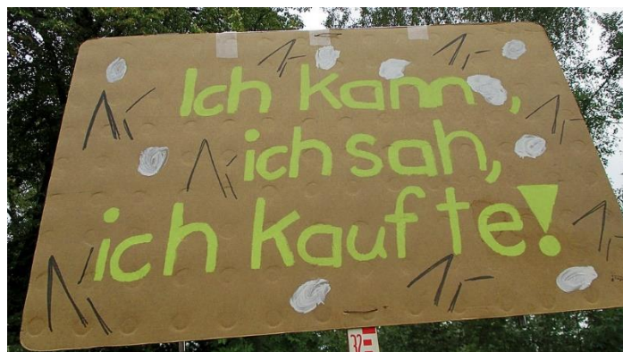
Von Lupus in Saxonia - Eigenes Werk, CC BY-SA 4.0, https://commons.wikimedia.org/w/index.php?curid=77138910

Jackson, Tim: Paradies-Verbraucher. Aufstieg und Fall der Konsumgesellschaft , http://www.umweltethik.at/detail.php?id=291 , 1.12.2012; Ropke, Inge: Konsum: Der Kern des Wachstums , in: Seidl, Irmi, Zahrnt, Angelika: Postwachstumsgesellschaft. Konzepte für die Zukunft , Marburg 2010, S. 103-116.